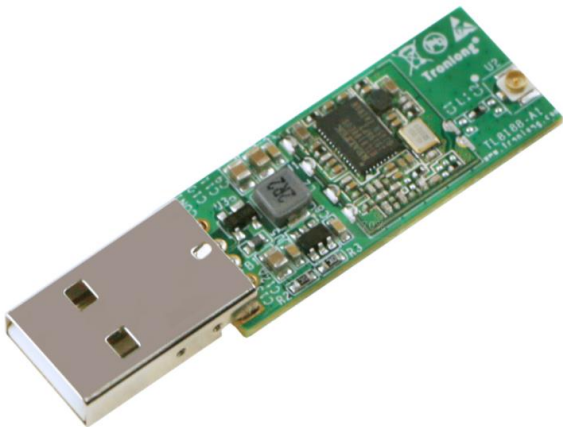
图 2 模块斜视图